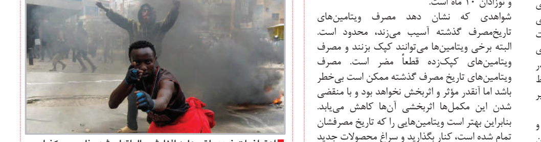
اعتراضات ضد دولتی علیه افزایش مالیاتها - شهر نابریوی کوبا