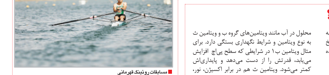
مسابقات روئینگ قهرمانی

بسیاری از ما روزانه ویتامین‌ها و مکمل‌های غذایی مصرف می‌کنیم، اما به‌جز آهن، کمبود کدام ویتامین‌ها و مواد معدنی عامل خستگی است؟ ویتامین دی: از هر شش بزرگسال بریتانیایی، یک نفر کمبود ویتامین دی دارد که یکی از علائم آن خستگی است. کمبود ویتامین دی را می‌توان از طریق نور خورشید و مواد غذایی مانند ماهی چرب، زرده تخم‌مرغ، محصولات لبنی غنی‌شده و مکمل‌های غذایی جبران کرد. ویتامین ب۱۲: خستگی در افراد مسن‌تر به کم‌خونی ناشی از کمبود ویتامین ب۱۲ یا فولات برمی‌گردد، که عمدتاً به‌دلیل مشکل جذب این ویتامین است. گوشت قرمز، گوشت مرغ و مایگان، غذاهای دریایی مانند ماهی سالمون و ماهی تن، محصولات لبنی مانند شیر، پنیر و ماست و همچنین تخم‌مرغ منابع غنی ویتامین ب۱۲ به شمار می‌روند. اگر خستگی یا خستگی شدید دارید حتماً به پزشک یا متخصص مراجعه کنید تا به علت اصلی آن پی ببرید. همچنین قبل از مصرف مکمل‌ها با پزشک مشورت کنید، زیرا مصرف بیش از حد ویتامین‌ها و مواد معدنی برای بدن مضر است.