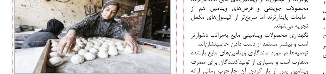
زن فلسطینی در حال پخت نان - نوار غزه